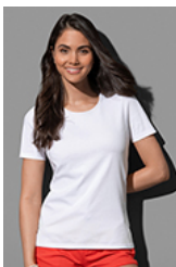
ST7600 Lux Fitted